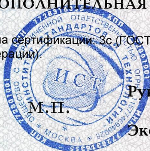
Схема сертификации: Sc (ГОСТ Р 53603-2020 Оценка соответствия. Схемы сертификации продукции в Российской Федерации).